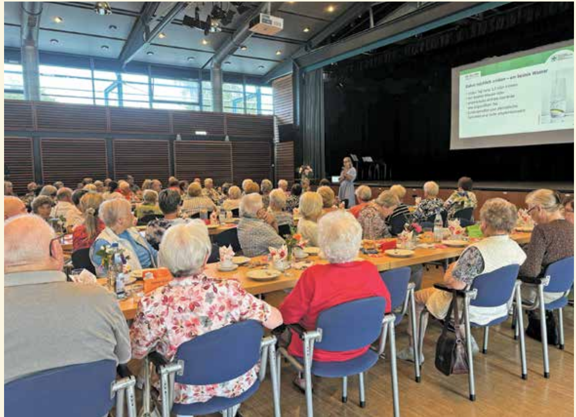
Gesund durch den Sommer - Ernährungsberatung im Fokus des Reichelsheimer Seniorenprogramms.

Ein solcher Nachmittag lässt sich jedoch nicht ohne tatkräftige Unterstützung realisieren. Die Gemeinde Reichelsheim spricht daher allen ehrenamtlichen Helfern einen