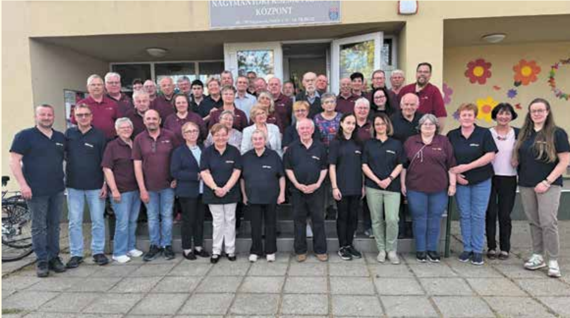
Reichelsheimer Delegation besucht Partnerstadt Nagymányok.

Reichelsheimer Delegation besucht Partnerstadt Nagymányok