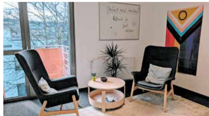
Einladend: In diesem Raum der Beratungsstelle finden die Gespräche statt.