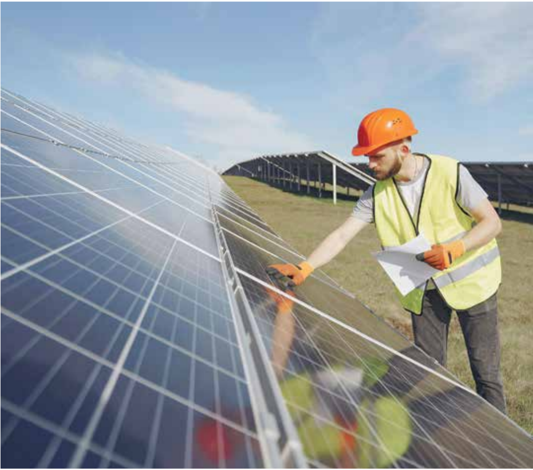
Erneuerbare Energien sind nicht nur klimafreundlich, sondern auch wirtschaftlich und geopolitisch eine sichere Wahl (Symbolbild).

ERNEUERBARE ENERGIEN Der Iran-Krieg und die derzeitige Energie-Krise zeigen: Grüne Investitionen sichern die Zukunft