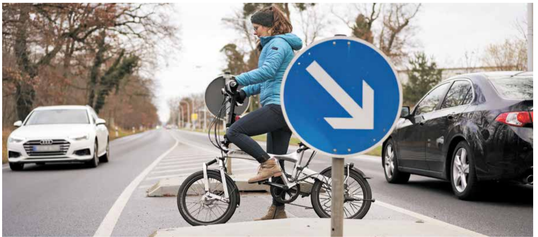
Radwegepaten und -patinnen haben wichtige Funktionen inne: Sie geben wertvolle Hinweise an das Landratsamt weiter und tragen somit aktiv zum Erhalt und zur Verbesserung der Radinfrastruktur bei.

Die Ermittler gehen derzeit nicht von einer Beziehungstat aus, die Hintergründe der Tat sind noch völlig unklar. Der Tatverdächtige konnte am Montag, 6. April, in Sandbach festgenommen werden. red