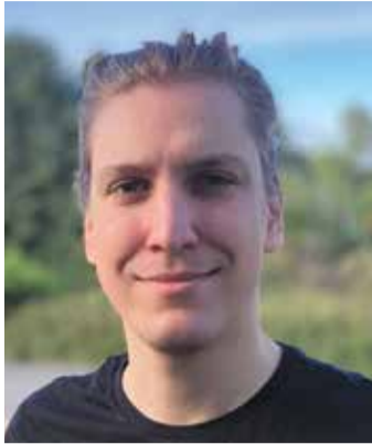
von Aleksandar Kerošević, Redaktionsleiter

Es braucht oft nicht viel. Ein paar Grad mehr, ein freundlicher Himmel – und plötzlich verlagert sich das Leben nach draußen. Was noch vor wenigen Tagen im Inneren stattfand, spielt sich nun wieder vor der Haustür ab. Man sieht es überall: Die ersten Stühle werden vor den Cafés gestellt, Parkbänke sind wieder besetzt, auf den Wegen durch den Odenwald begegnet man mehr Menschen als noch im März. Selbst kurze Erledigungen werden plötzlich zum kleinen Spaziergang. Es ist, als hätte jemand einen Schalter umgelegt. Dabei hat sich objektiv gar nicht so viel verändert. Die Temperaturen sind moderat, die Abende noch kühl, und der April bleibt unberechenbar. Und doch reicht dieser erste Vorgeschmack, um Gewohn-